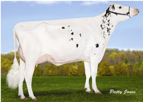
VELTHUIS SG SNOW EVENT THIRD DAM